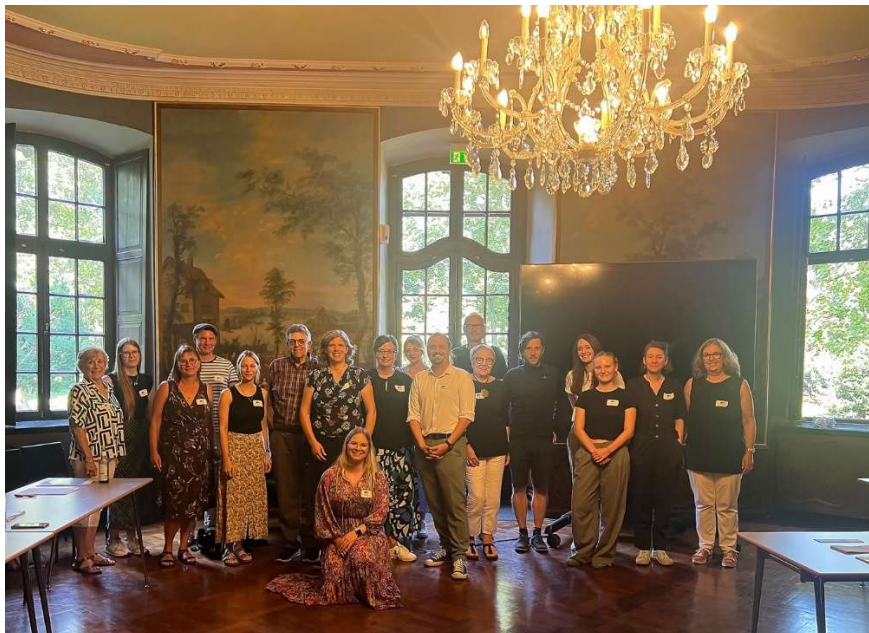
Internationaler Austausch und Netzwerkpfege zu inklusivem Lernen an der Universität Köln.