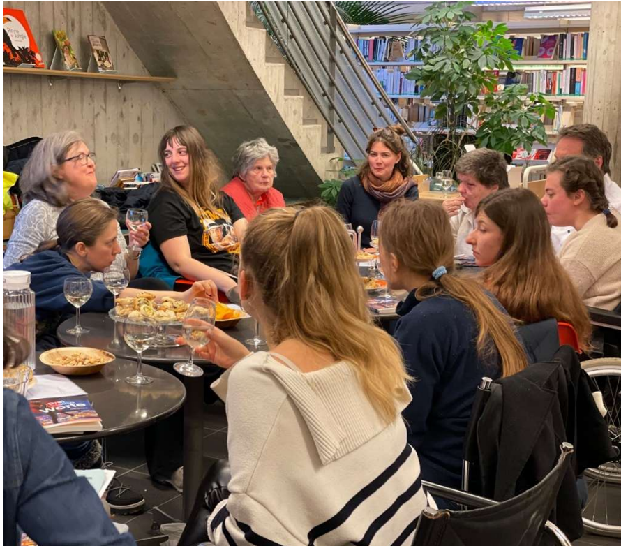
Happy Birthday LEA Biel!

Der erste Schweizer LEA Leseclub® in Biel feiert am 16. März 2024 seinen ersten Geburtstag!